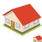
Icône de la MAISON INDIVIDUELLE (logement privé ou social)

Étape 3. Le formateur ou la formatrice dispose la fiche de la question 1 à un endroit visible et demande aux participant.e.s : Qui doit réaliser (ou faire réaliser) les travaux pour maintenir en bon état un logement ?