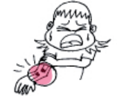
un bras cassé