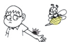
une piqûre d'abeille