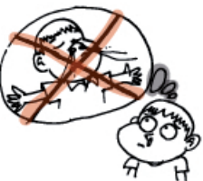
le nez bouché