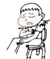
se sentir mal