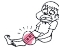
une jambe cassée