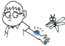
une piqûre de moustique