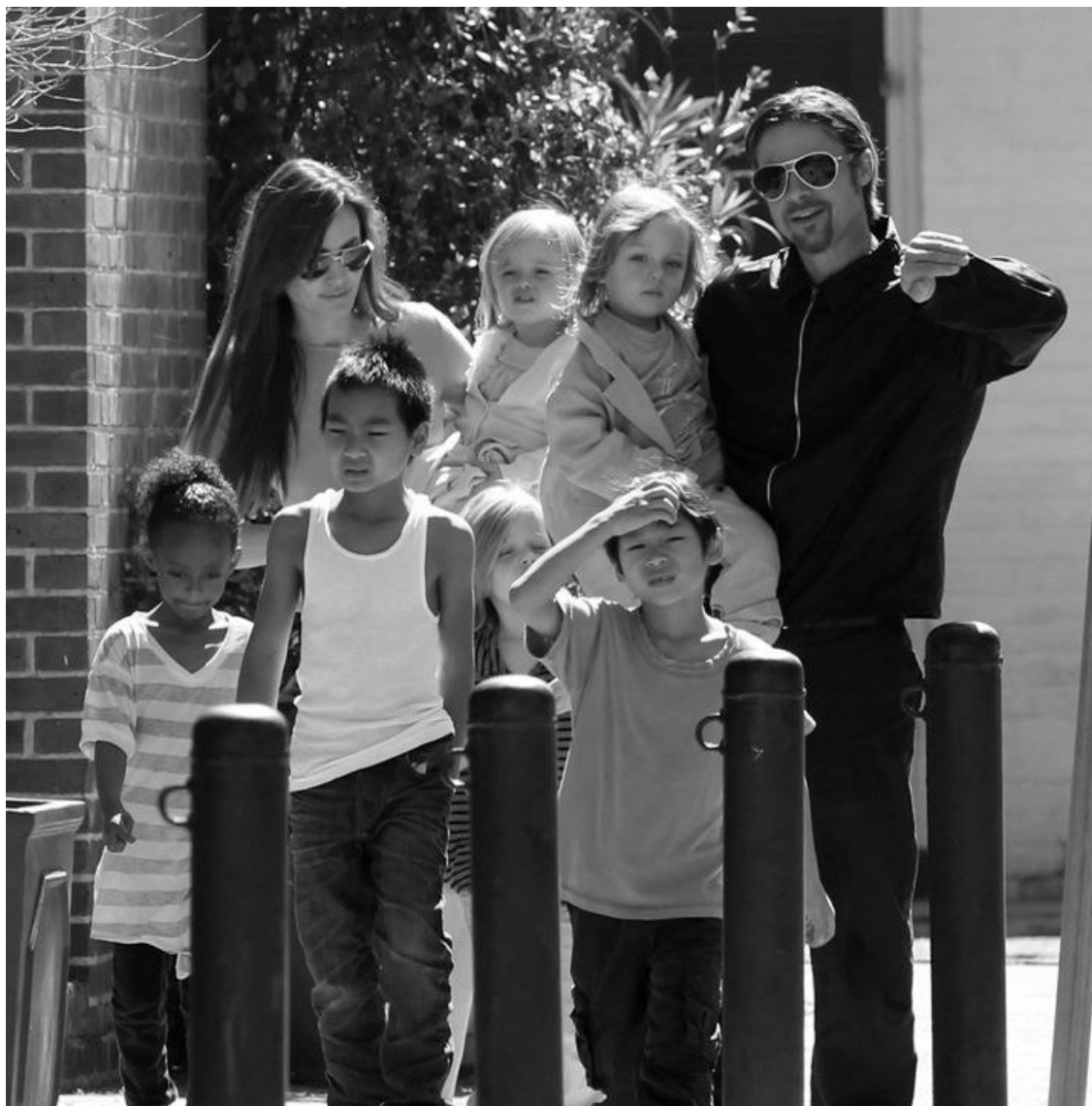
Photo à usage strictement pédagogique dans le cadre de la Formation à l'Intégration Citoyenne