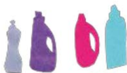
Tableau inspiré de Raffa, Le Grand Ménage, pp.24-25, Soliflor, 2009

Les HE sont à proscrire en présence d'enfants en bas âge et de femmes enceintes; elles sont aussi mal tolérées par les chats. Précaution : les doser avec parcimonie et arrêter leur usage face à toute réaction d'intolérance cutanée ou respiratoire.